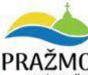
PRAŽMO vesnice na dlani

DOLNÍ DOMASLAVICE OBČANÉ SPOLU - NEZÁVISLÍ